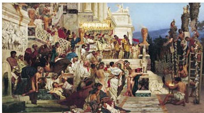
Рис. 1. «Светочи христианства (Факелы Нерона)». Картина Г.Семирадского, 1882.

В римских летописях (Анналы XV.44) записано о казнях христиан следующее: «Их умерщвление сопровождалось издевательствами, ибо их облачали в шкуры диких зверей, дабы они были растерзаны насмерть собаками, распинали на крестах, или обреченных на смерть в огне поджигали с наступлением темноты ради ночного освещения.»