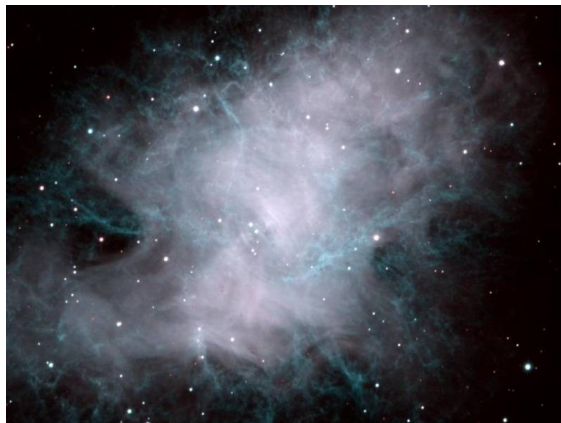
Рис.4. Крабовидная туманность – остаток грандиозного взрыва звезды SN1054

туманности ..., в этом остатке наблюдается пульсар ...». Звезда-пульсар – остаток взорвавшейся звезды, космический «маяк», посылающий в космос сигналы правильной формы, которые вначале были приняты за сигналы внеземных цивилизаций.