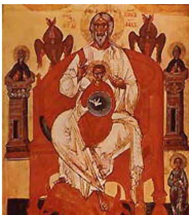
Рис.5. Бог Отец и Бог Сын. Новгородская икона «Троица новозаветная.» нач. 15 в.

«Слова» — Логоса (смыслового и оформляющего Начала) и Святого Духа («животворящего» Начала). Сын рождается от Отца, Святой Дух исходит от Бога Отца. Иисус Христос – Бог Сын (имя Иисус означает – Спаситель, помощник Бога).